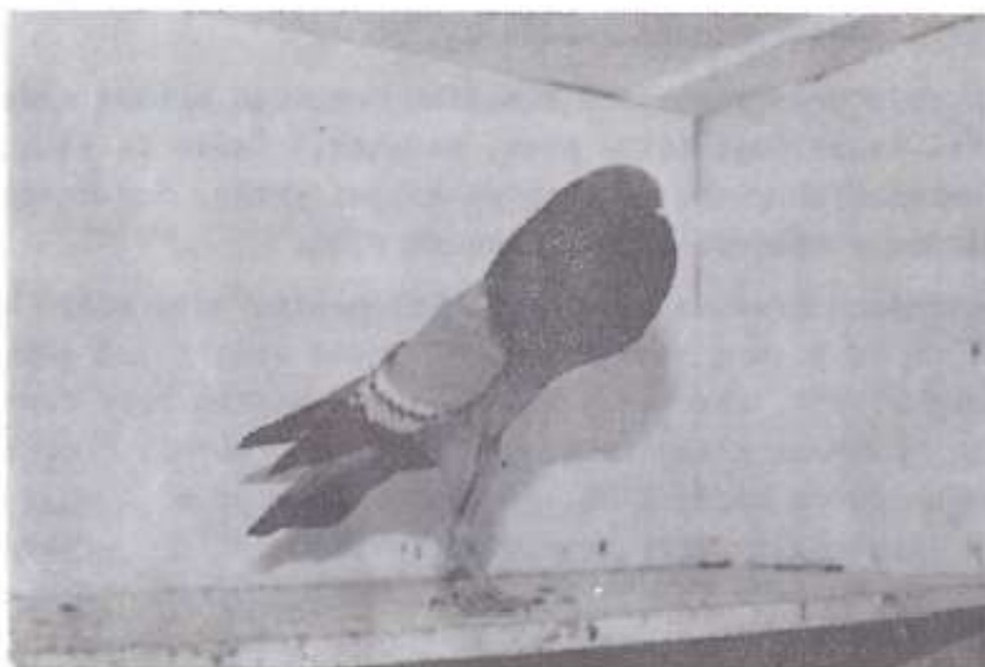
Modrý bělopruhý brněnský voláč ze západoněmeckého chovu.